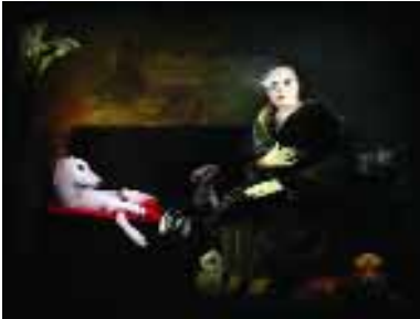
“Retrato de Familia”, de Sergio Fasola