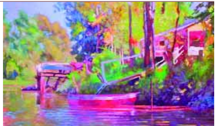
"Casa del Delta", de Alfredo Bernet