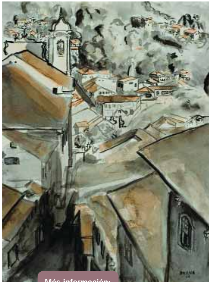
"Vista de Ouro Preto", de Nicolás Gabriel Barna