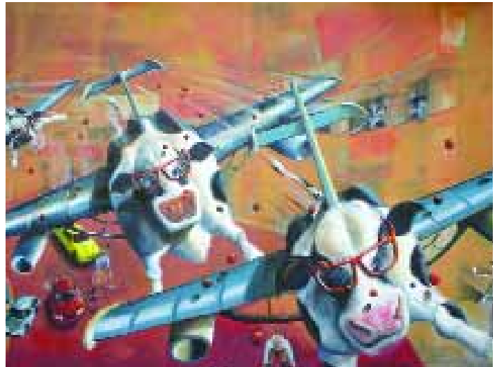
"Vacas con anteojos", de Alejandro Maass