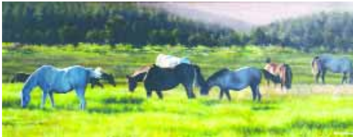
"Pastando", de Ricardo Bonati