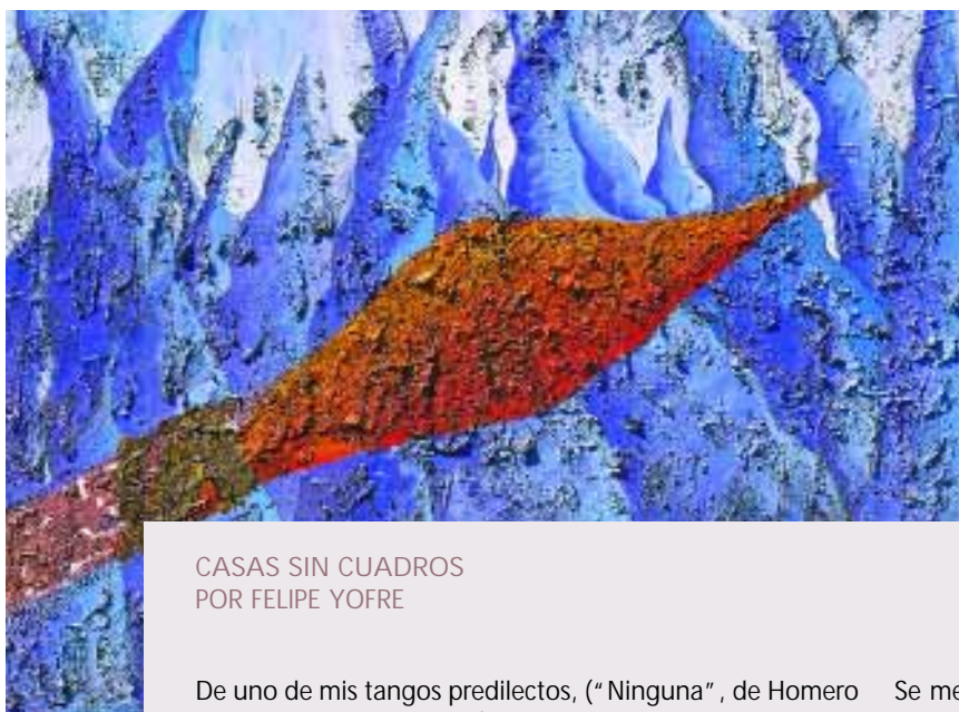
“Soy flecha que anhela la herida”, Pierrri. Museo Sivori.

Paseo de Compras Santa Bárbara (local 16) todos los días de 11 a 22 hs. Tel.: 4740-0730. E-mail: abgaleria@gmail.com