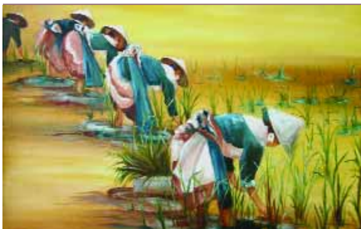
"Sembrados de arroz", de Lucila Marot