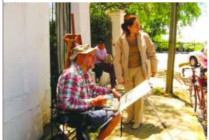
Concurso "Las cuatro estaciones"